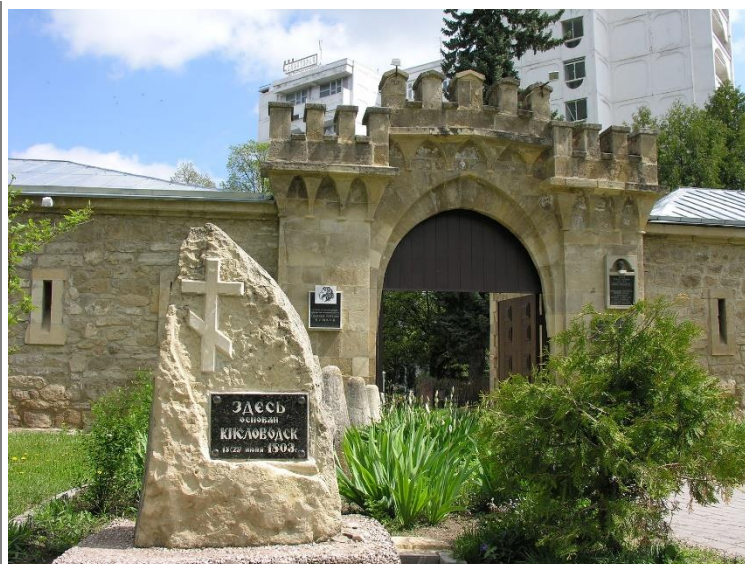
Кисловодский краеведческий музей «Крепость»