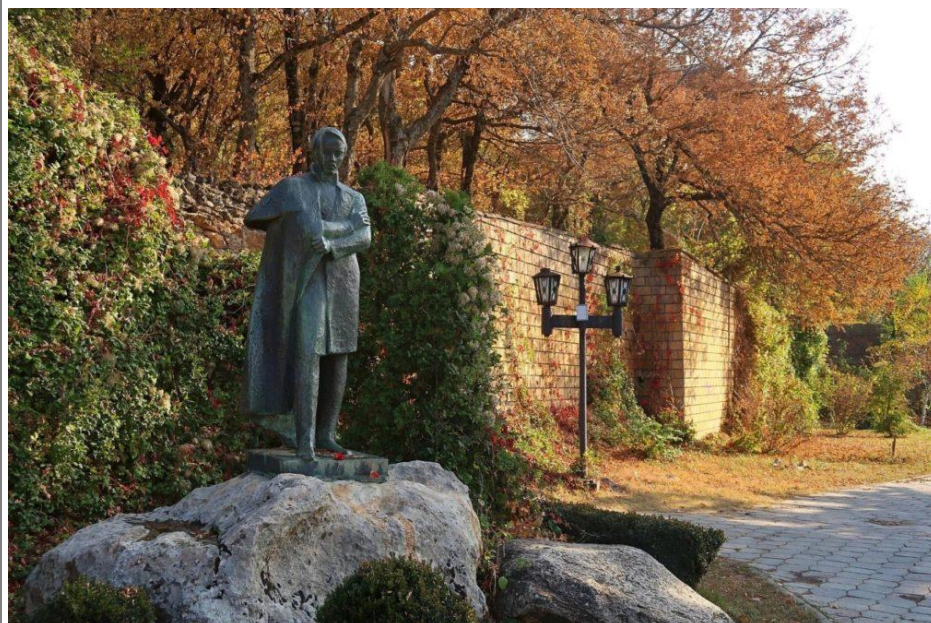
Лермонтовский сквер в Железноводске

1 день: Экскурсия по городу-курорту Пятигорску , в ходе которой экскурсанты увидят самые известные достопримечательности и архитектурные памятники Пятигорска, посетят исторические места. Из гостиницы группа отправляется в автобусе на юго-восточный склон горы Машук к Озеру «Провал» – популярной среди местных жителей и гостей города достопримечательности города Пятигорска.