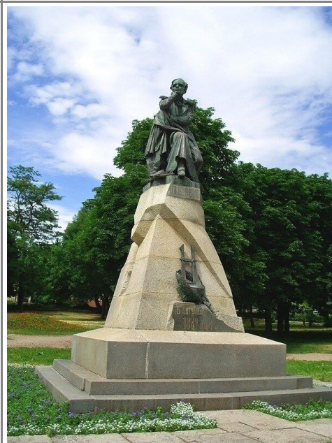
Памятник М.Ю. Лермонтову