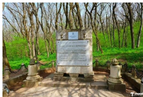
Место дуэли Лермонтова на склоне горы Машук