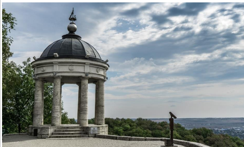
Эолова Арфа в Пятигорске