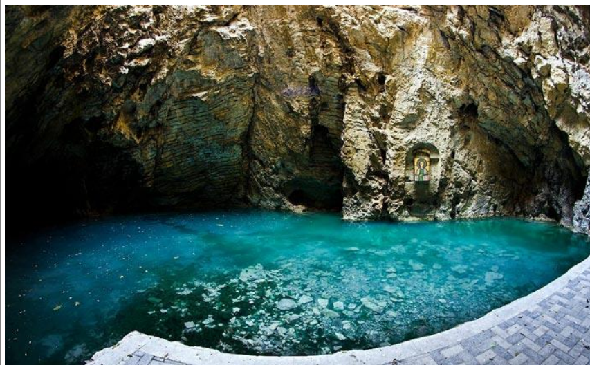
Озеро Провал в Пятигорске